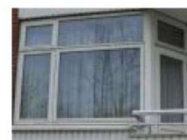
Eksempel på altanvinduesparti på blok 1