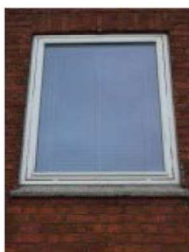
Gælder alle blokke

Farver: udvendigt; vinduer og altandøre: hvid Ral 9010. Hoveddøre: Mahogni.