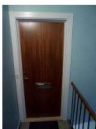
Gælder alle blokke